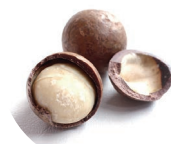
マカデミア種子油 *1