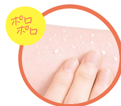
ポロポロができてきたら 洗い流してすべすべ肌!