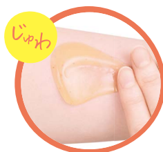
じゅわっと肌でとろけて、 じんわりあたたか